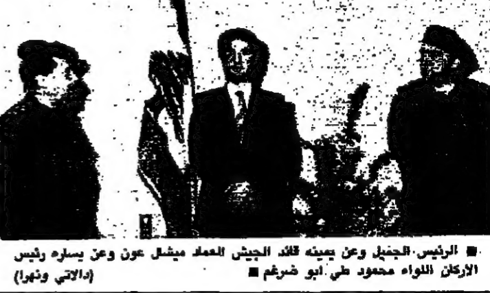
الرئيس الجنرال عون يبينه قائد الجيش العميد ميشال عون وعن يساره رئيس الأركان اللواء محمود علي أبو شريم (اليمين)

أقر المجلس العسكري في اجتماعه امس برئاسة العميد ميشال عون وحضور الاعضاء ولجنة الارتباط للسلاح ، وارتكان قيادة قوى الامن الداخلي خطة مرحلية لتنفيذ خطة انتشار الجيش حتى الاولي . وذكر مصدر عسكري انه تم الاتفاق خلال الاجتماع على برنامج عمل لتنفيذ خطة السلاح ، يبدأ تنفيذ يوم غد الأربعاء ، ويستغرق بين خمسة او تسعة ايام ، على ان ينتشر الجيش في مطلع الاسبوع المقبل . ويتضمن البرنامج سحب الاسلحة وتجميعها في الجبهه وادارها على النحو الاتي : ١ - يشار كل فريق بتجميع اسلحته في المكان المحدد له . ٢ - يشار كل فريق بنزع الانغام المزروعة في منطقتهم . ٣ - تدخل قوى الامن الداخلي وتقوم باستطلاع الوضع ، والتأكد من تنفيذ قرار نزع الانغام . ٤ - فتح الخطر المقلقة . ٥ - تدخل قوى الامن الداخلي الى القرى الغريبة من أجل التحدث مع اسلحتهم الثقيلة وتخزينها . ويجوز المصدر ان يتم دخول الجيش يوم الاثنين المقبل ، في حين قالت مصدر اخرى ان هذه الخطة قد تنجز قبل الخمس من الشهر الحالي . وكانت لجنة الارتباط عدت (البلقة على الصفحة ١٠)